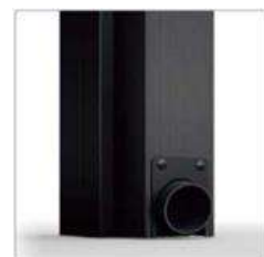
アルミたて樋カバー